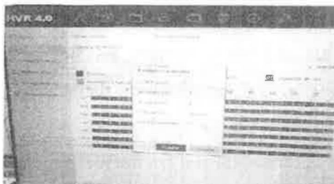
Imagen 4. Configuración de grabación continua y de hora de vencimiento de videos.

indica que el tiempo real de conservación del archivo debe determinarse según la capacidad de almacenamiento con la que cuente el grabador (DVR).