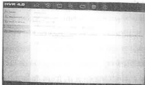
Imagen 5. Característica de sobrescritura habilitada en el DVR.

Finalmente, el parámetro de Sobrescribir se encuentra habilitado, que refiere a que las nuevas grabaciones reemplazarán a las más antiguas cuando el espacio de almacenamiento este lleno, lo que significa que los datos más antiguos en el disco duro serán sobrescritos para que ese espacio sea ocupado por los datos de las nuevas grabaciones.