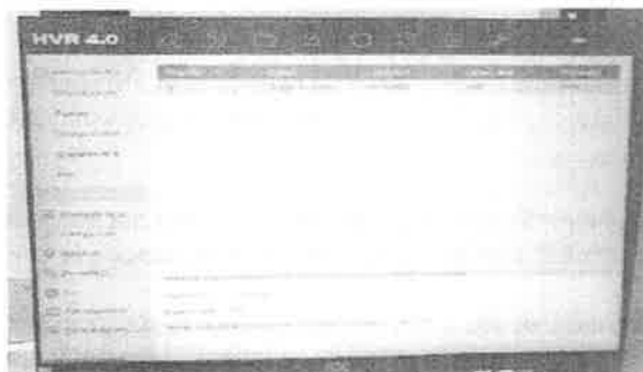
Imagen 3. Disco duro instalado de 9314 GB de almacenamiento y tiempo estimado de grabación de 14 días.

Adicionalmente, cabe señalar que todas las cámaras tienen los mismos parámetros configurados de grabación, como lo es la grabación continua y el tiempo que durará el almacenamiento. Para este último, el tiempo de conservación que tienen todas las grabaciones está dado mediante el parámetro de Hora de vencimiento (Expires time), el cual está en un valor de 0 (cero), lo que