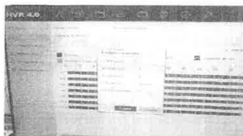
Imagen 4. Configuración de grabación continua y de hora de vencimiento de video.

indica que el tiempo real de conservación del archivo debe determinarse según la capacidad de almacenamiento con la que cuente el grabador (DVR).