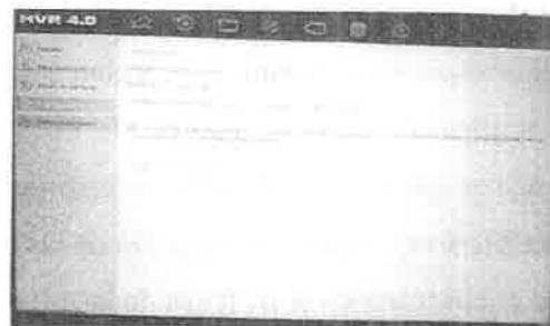
Imagen 5. Característica de sobreescritura habilitada en el DVR.

Finalmente, el parámetro de Sobreescibir se encuentra habilitado, que refiere a que las nuevas grabaciones reemplazarán a las más antiguas cuando el espacio de almacenamiento esté lleno, lo que significa que los datos más antiguos en el disco duro serán sobrescritos para que ese espacio sea ocupado por los datos de las nuevas grabaciones.